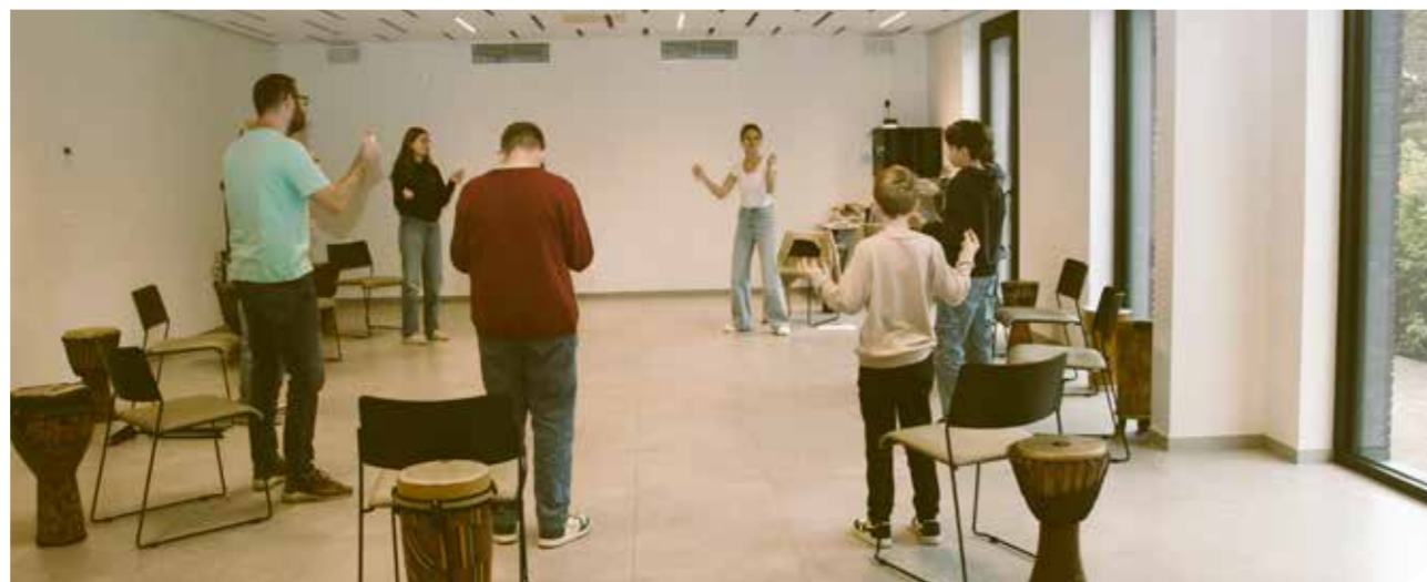
De workshops bruisen van de activiteit. Afspraak op het Jeugdorkestenfestival 2024 op zaterdag 23 november in Stokkem.

samenleving. Het jeugdorkestenfestival zet hierop in met workshops, concerten en leuke creatieve randactiviteiten. De tweede editie vond plaats op 22 oktober 2023. In een workshop dachten de bestuurders van de verenigingen na over jeugdwerking. Hun devies was duidelijk. Ga naar buiten! Tracht aanwezig te zijn op elke manifestatie van de gemeenschap waarin je actief bent. Dat hoeft niet altijd met het volledige orkest. Een klein ensemble is een volwaardige ambassadeur. In de wetenschap dat we maatschappelijk bijzonder relevant zijn, is er geen reden om te aarzelen. Laten we onszelf promoten als een aantrekkelijke, leuke en leerrijke activiteit met maatschappelijke relevantie.