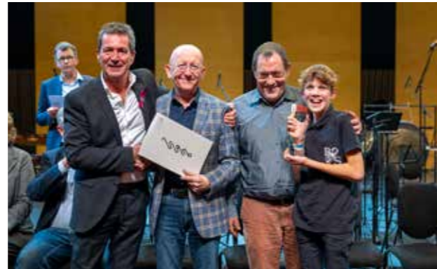
Kon. BB "De Grensbewoners" Smeermaas, winnaar eerste afdeling