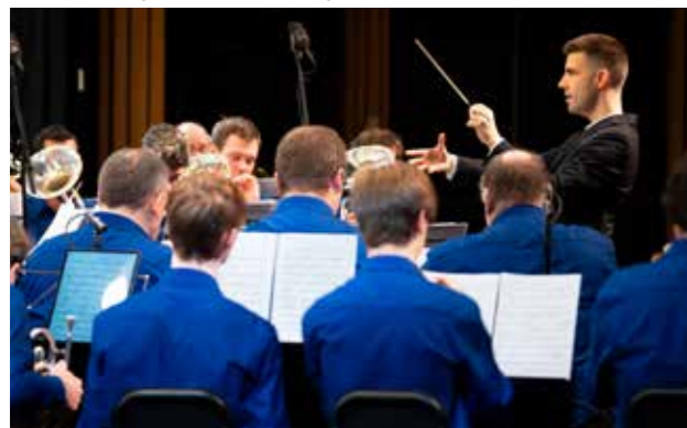
BB Panta Rhei, winnaar tweede afdeling