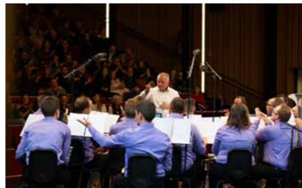
BB Willebroek, winnaar kampioensafdeling