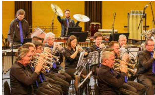
BB Zuid-Limburg, winnaar open afdeling